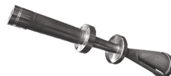
MTB12 - Ev Burner