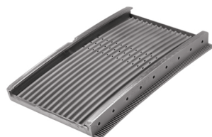
MTB12 - Outer Segment 3