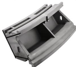
MTB12 - Stator Heat Shield Row 3