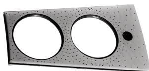
MTB12 - Front Segment