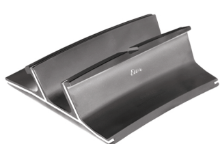
MTB12 - Stator Heat Shield Row 1